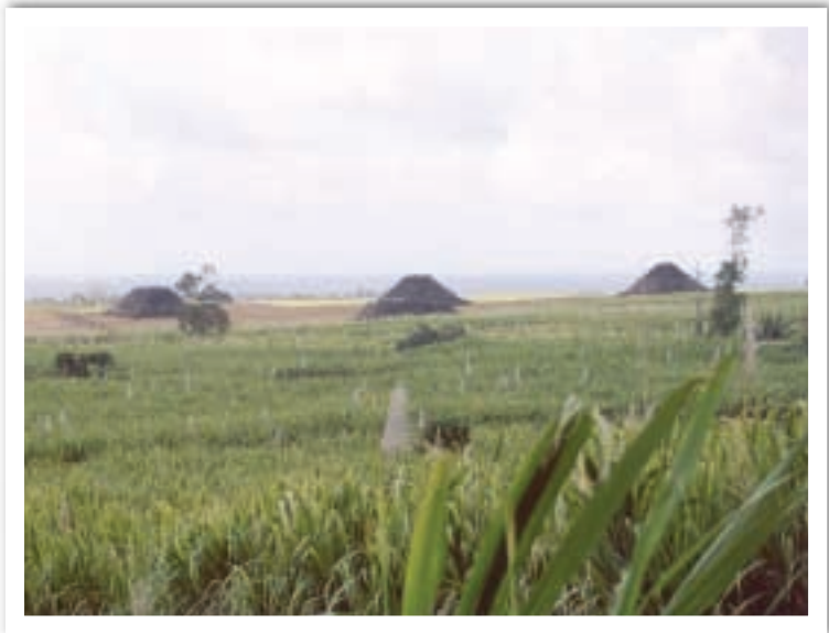
CUATRO PIRÁMIDES EN EL INTERIOR DE UNA PLANTACIÓN EN MAURICIO. LAS DIMENSIONES DE LOS MAJANOS SON ENORMES, ENTRE 20 Y 30 METROS DE LARGO, ALGUNA DE ELLAS PUEDE TENER INCLUSO ALREDEDOR DE 15 METROS DE ALTO.